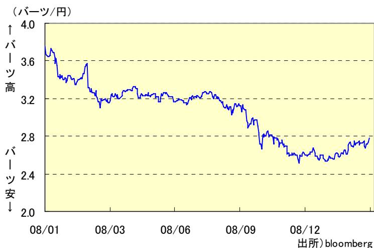
為替相場の推移(終値ベース)

09年入り後は、新政権発足による政情安定化期待から一旦買い戻され、現在は2.7円台後半での推移となっている。